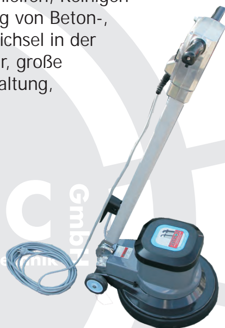
Bedienergriff mit Totmannschaltung

Jede Menge Zubehör für Schleifen, Reinigen oder Untergrundvorbereitung von Beton-, Estrich- oder Holzböden. Deichsel in der Neigung stufenlos verstellbar, große Transporträder. Totmannschaltung, Metallgehäuse.