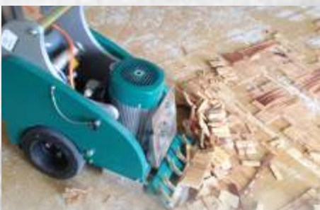
Parkett / Hartholz Bodenbelag