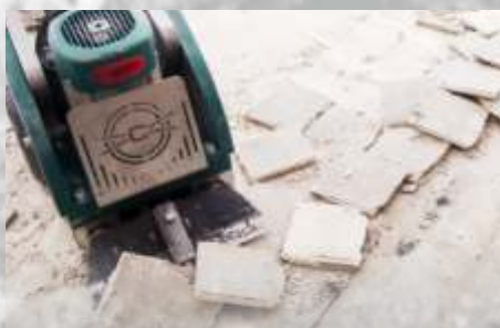
Keramikfliesen aller Größen