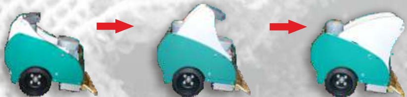
Max. Gewichtsübertragung auf die Klinge.