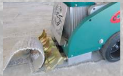
Beschichtungen / Epoxidharz / Teppich