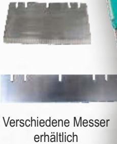
Verschiedene Messer erhältlich

OX Der kleinste der CONTEC-Stripperfamilie - kompakt, zuverlässig und bärenstark!